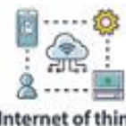
Internet of things