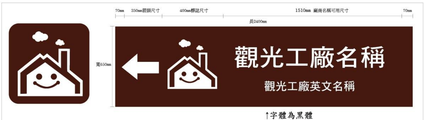
觀光工廠圖案造型預嵌指示標誌牌面格式